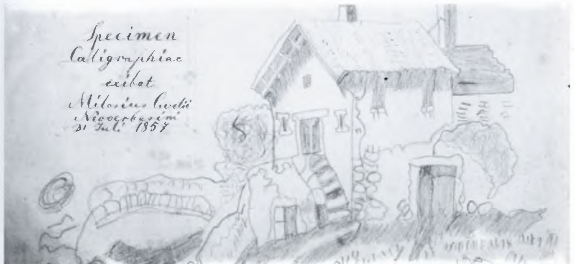
4. Цвејићева црцанка: Specimen Caligraphiae , 31. јул 1857.