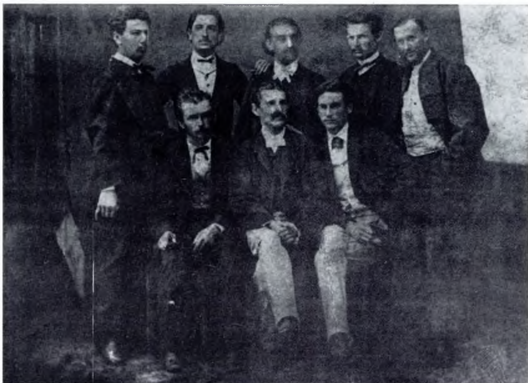
9. Први чланови Народног позоришта у Београду