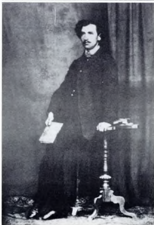
10. Милош Цвечић на почетку каријере