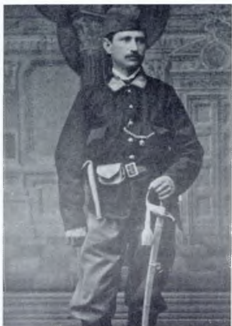
17. Цвејић као војник за време Првог српско-турског рата, 1876.