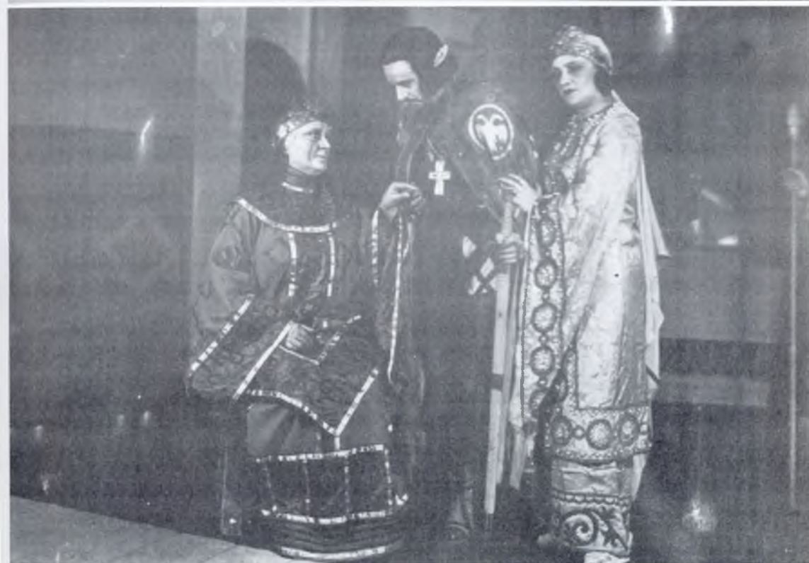
39. Сцене из представа Немања у режији Раише Плаовића, Народно позориште у Београду, 1930.