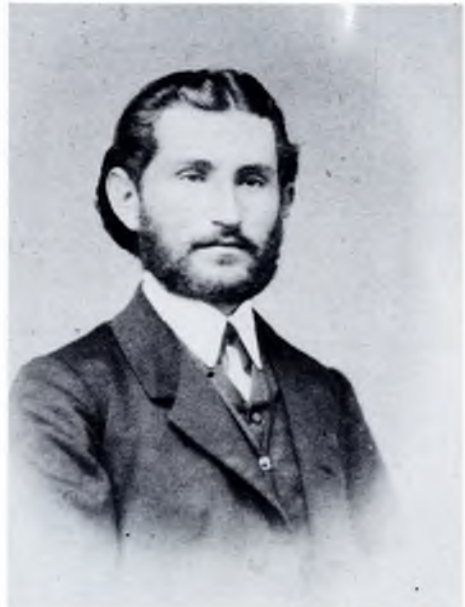
1. Милош Цвейић за време боравка у Прагу и Бечу, 1868. и 1869.