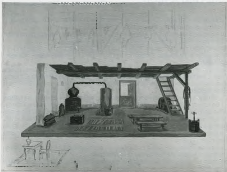
Ј. С. Поповић ЛАЖА И ПАРАЛАЗА 1980. режија Дејан Мијач