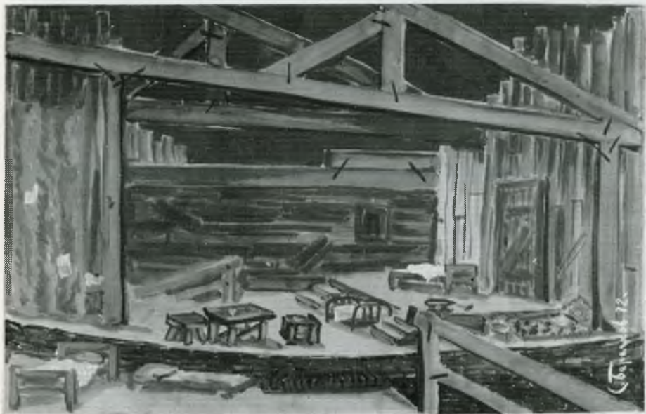
М. Горки НА ДНУ 1972. режија Петар Говедаровић

Деведесет представа у блиској визури. Деведесет живота. Деведесет светова. Као деведесет судбина. Као деведесет испита, најтежих испита на претешком Универзитету уметности и живота, схватања и допадања или обрнуто. Деведесет сценографија за тридесет година! Три таква дружења